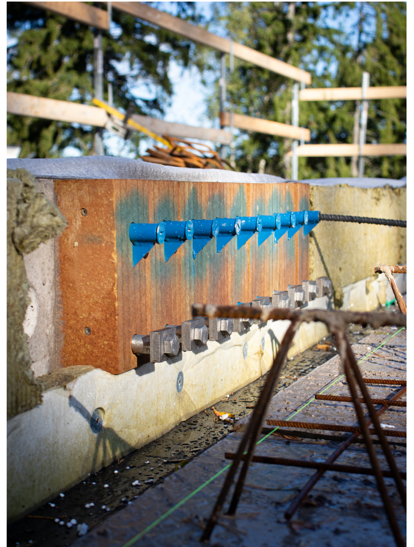
Projekt BRF Silva i Ytterby. Entreprenör: ByggArvid.

Hållbarhet är en del av vår kärna, och vi arbetar aktivt för att integrera den i alla delar av vår verksamhet. Genom vår verksamhet har vi både möjlighet och ansvar att påverka flera av målen på ett positivt sätt.