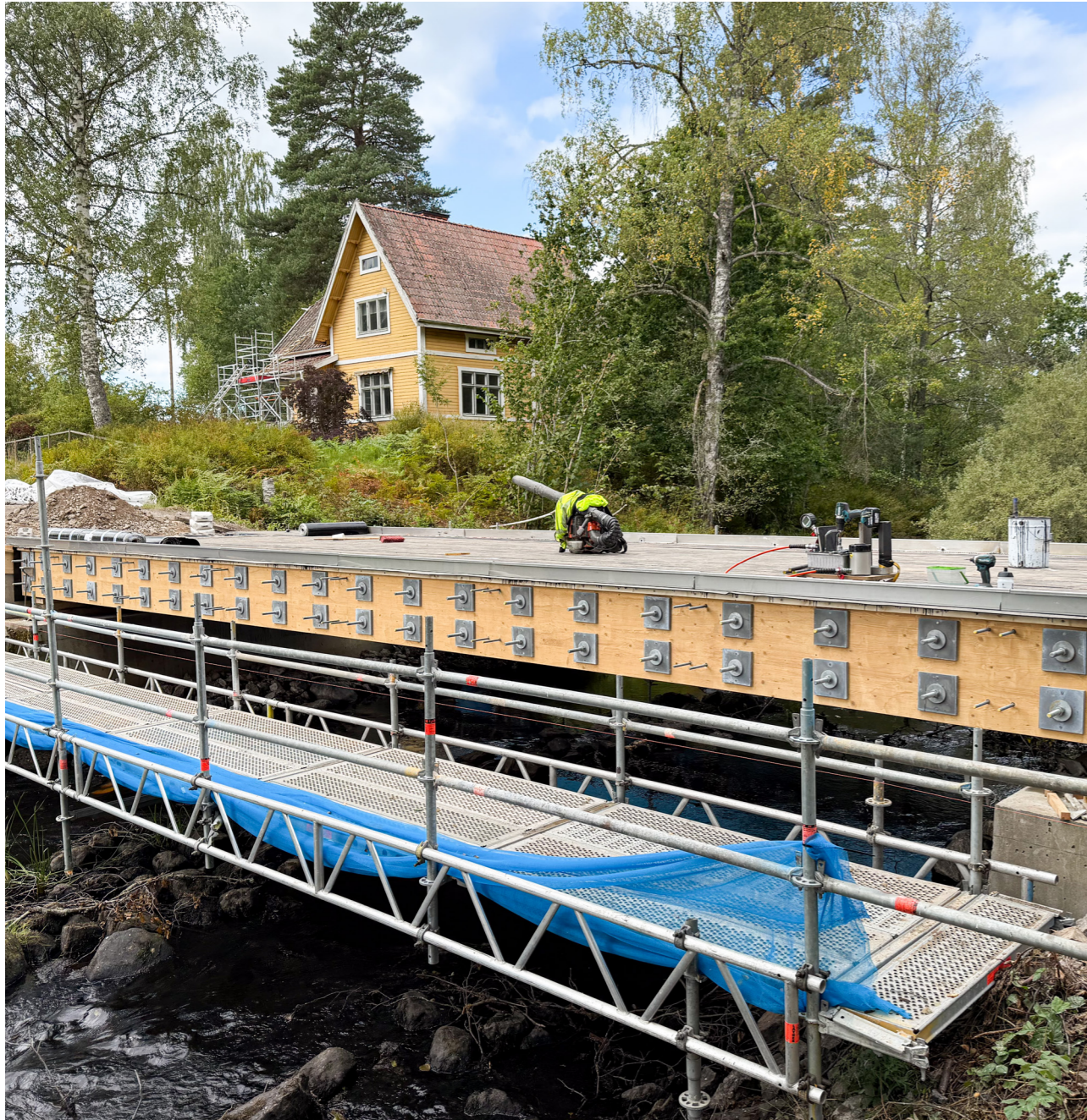
Träbro i Östergötland. Entreprenör: TBS Timberbridge.