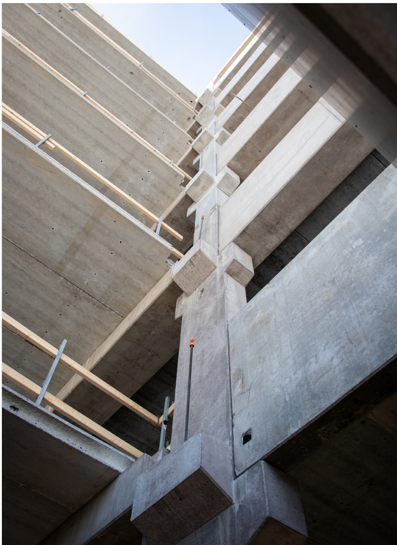
Södra Änggården Parkeringshus. Entreprenör: CarlGustav Solutions.