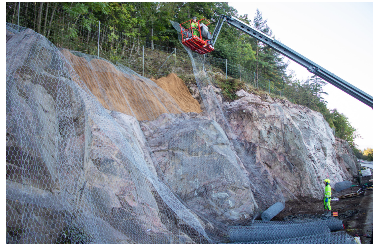
Nätning E4 Huskvarna-Gränna. Entreprenör: Stabilt Berg och Betong.

Långsiktigheten i vårt ekonomiska arbete skapar trygghet för våra kunder, medarbetare, leverantörer och ägare. Genom stabilitet och förutsägbarhet kan vi fortsätta vara en pålitlig partner, investera i innovation, kompetensutveckling och hållbara lösningar samt bidra till en robust värdekedja. Den ekonomiska hållbarheten ger oss också utrymme att växa på ett kontrollerat och ansvarsfullt sätt, i takt med branschens behov och framtida krav.